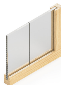
JEDNODUCHO PRESKLENÁ PRIEČKA