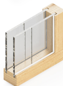
DVOJITO PRESKLENÁ PRIEČKA