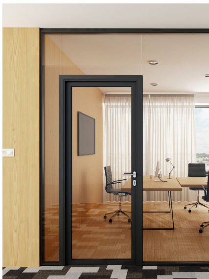
Jednokridlové presklené dvere s hliníkovými rámami so stĺpovým nadsvetlíkom