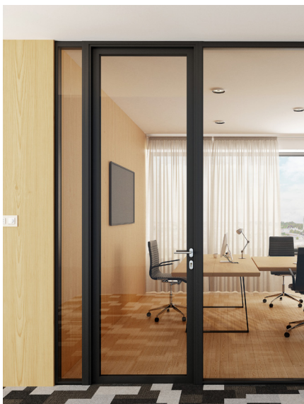
Jednokridlové presklené dvere s hliníkovými rámami s plnou výškou