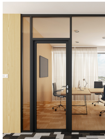
Jednokridlové presklené dvere s hliníkovým rámom a nadsvetlíkom