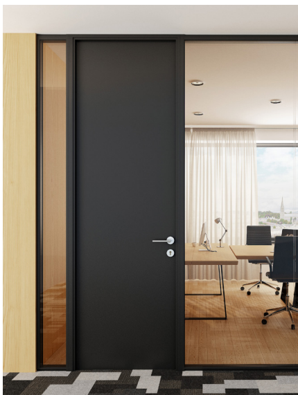
Jednokridlové drevené dvere s plnou výškou