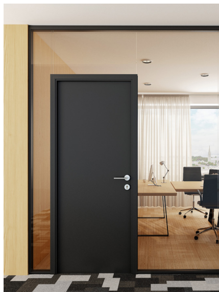
Jednokridlové drevené dvere s nadsvetlíkom