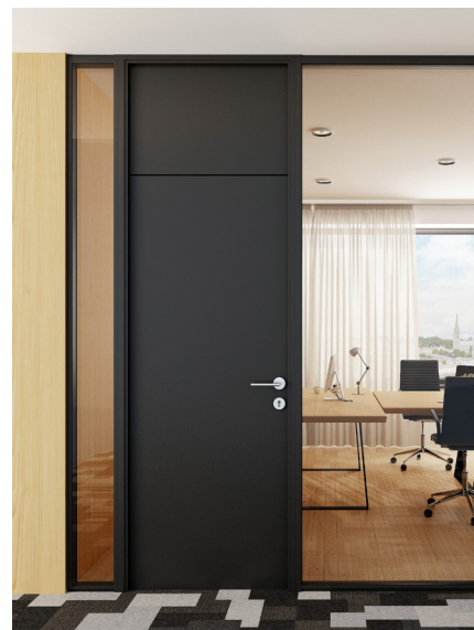
Jednokridlové drevené dvere s nadpanelom