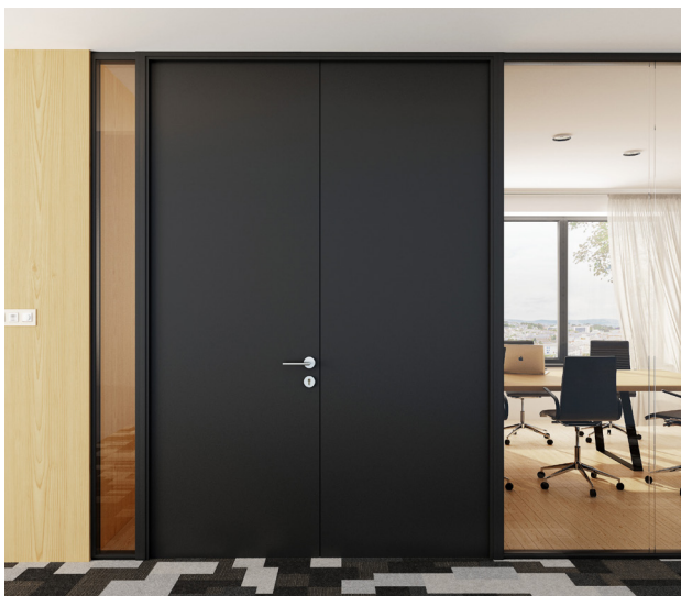
Dvojkridlové drevené dvere s plnou výškou