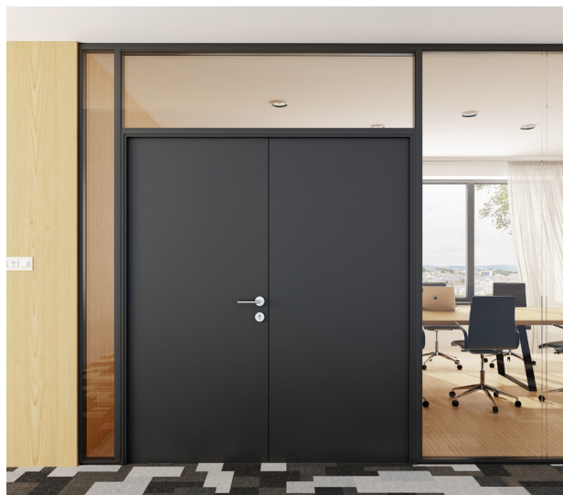
Dvojkridlové drevené dvere s nadsvetlíkom